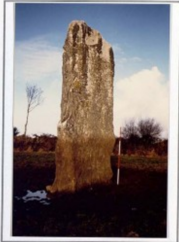
Gourin: Menhir de Kerbiquet Lann