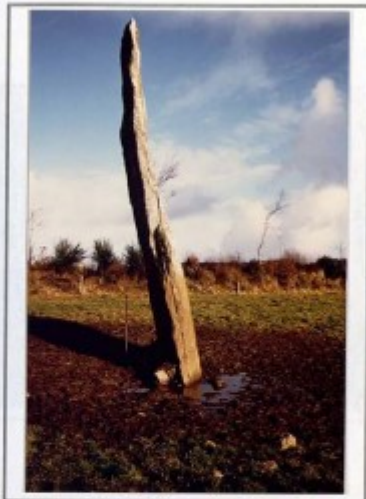
Gourin: Menhir de Kerbiquet Lann

Noter: -les traces de frottement laissées par les bovins sur le menhir -la détérioration du sol sur dix mètres de diamètre-